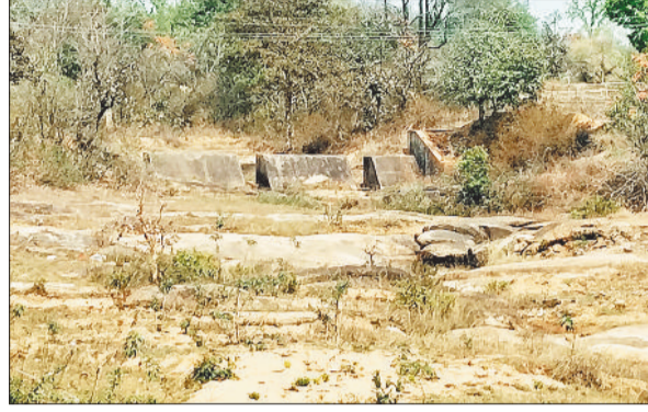
सूखा स्टॉप डेम।